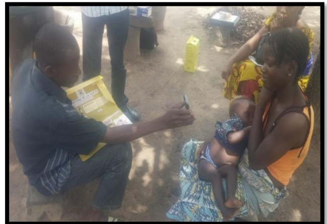
RC faisant le counseling PF à l'aide de CommCare à une mère après la prise en charge de son enfant. Photo prise à Tchaourou, 09/09/2015 par Marius Awonon

Module Planification Familiale (PF) : Le module PF de l'application, utilisé lors du counseling, dispose d'un contenu audio et vidéo en huit langues locales. L'utilisation de ce module a permis d'augmenter la prévalence contraceptive. En 2014, avant la mise en place de CommCare par ANCRE, sur un échantillon de 10 femmes ayant reçu le counseling PF, aucune n'acceptait une méthode de PF. En Avril 2017, après deux ans d'utilisation de CommCare, quatre femmes sur 10, soit 40%, ont accepté d'utiliser une méthode de PF après un counseling auprès du RC, via l'application mobile.