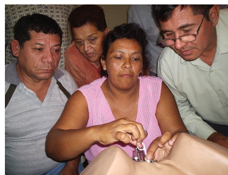
Personal médico y de enfermería durante la capacitación sobre inserción de DIU practica con un modelo pélvico

Este giro que los hospitales del país dan con relación a la atención y eficiencia con que prestan los servicios de planificación familiar es bien recibida por la población. Al ser entrevistadas, a la salida del servicio de salud, un grupo de usuarias de 11 hospitales de Huehuetenango, Sololá, Quetzaltenango, y Tiquisate, manifestó percibir una mejor atención y mejor disposición del personal del hospital por brindar información de planificación familiar y permitir su decisión libre e informada sobre el método de planificación familiar que más se ajusta a sus necesidades.