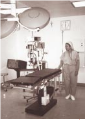
La nueva sala de cirugía obstétrica en el Hospital Regional de Quetzaltenango

La clave para el éxito de este paso es lograr soluciones concretas. El ejemplo del Paso 9 del equipo del Hospital de Sololá podría tener soluciones más detalladas y concretas. Consulte la Sección de Profundización del Diseño de Calidad (la última sección del estudio de casos) para obtener más detalles sobre cómo enfrentar mejor este paso.